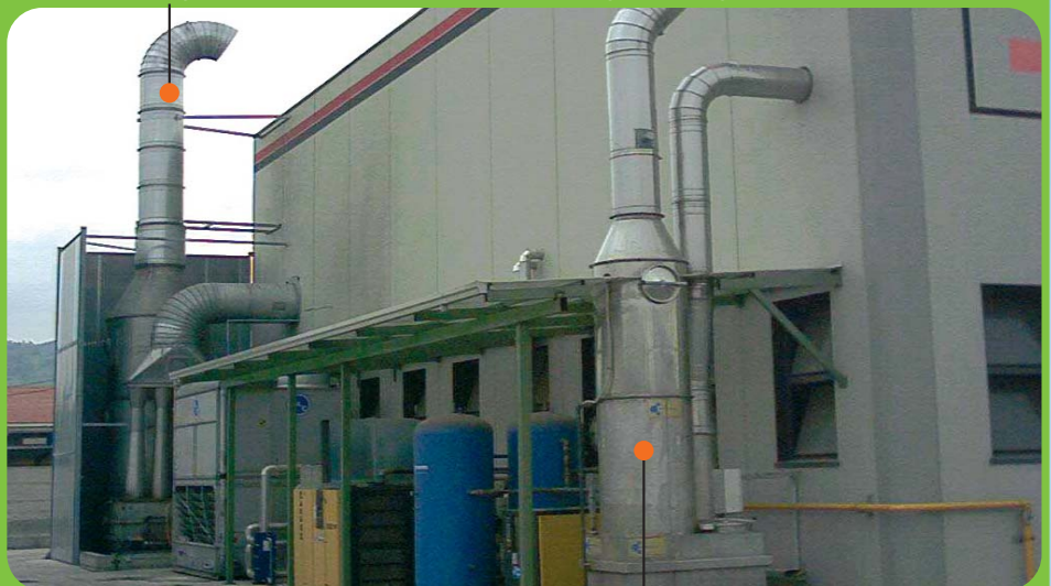
Abbattimento polveri e fumi acidi da SCORIFICA forno fusorio con Venturi-Scrubber di nuova generazione Acid fumes and dusts treatment from melting furnace with new generation Venturi-Scrubber