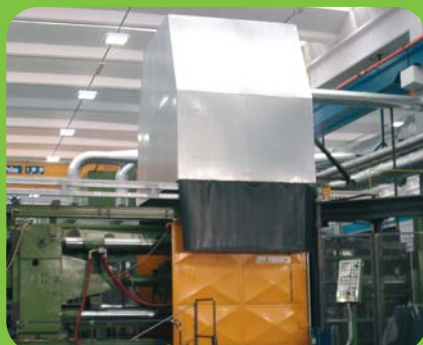
Filtro statico abbattimento vapori oleosi Static filter oil vapours treatment