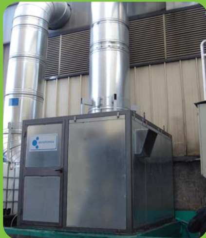
Sistemi di insonorizzazione Soundproofing system