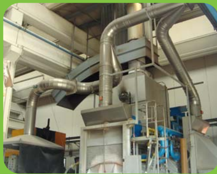
Particolare di aspirazione fumi acidi da scorifica su forno Striko Westofen Detail of aspiration of acid fumes from Striko Westofen furnace