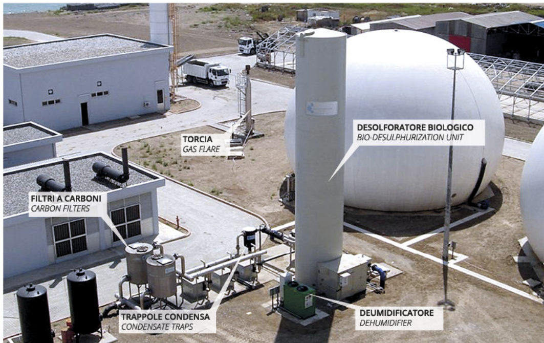
Componenti per il trattamento del biogas da digestione anaerobica di fanghi Components for biogas treatment from anaerobic sludge digestion